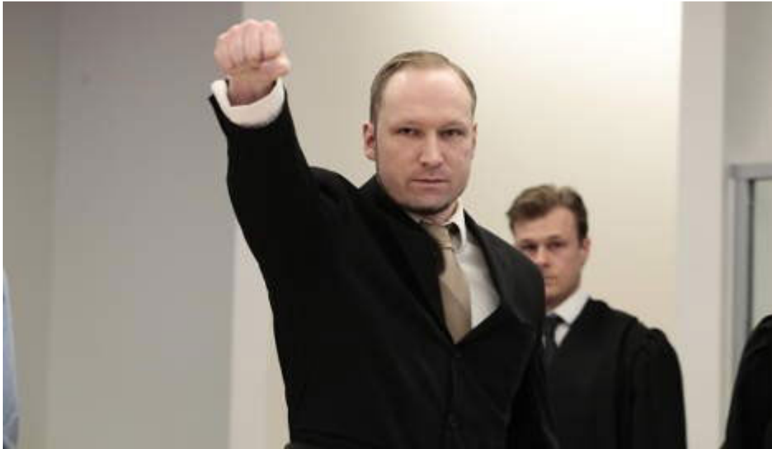
De meest dodelijke aanslag tot 13 november 2015 werd gepleegd door Anders Breivik.

Dit suggereert continuïteit, waarbij de aanslagen in Parijs slechts een volgend hoofdstuk lijken te zijn in de ontwikkelingen van het jihadisme in Europa. De dreigingsbeelden die tussen 2005 en 2015 gepubliceerd zijn, laten echter deels een ander beeld zien. Zo hebben we in de afgelopen tien jaar slechts een enkele keer met grootschalige terroristische aanslagen te maken gehad. Bovendien kwam de meest dodelijke aanslag waar Europa tussen 2005 en oktober 2015 mee geconfronteerd werd niet uit jihadistische hoek, maar van extreem-rechts: Anders Breivik, die in 2011 bijna tachtig mensen vermoordde in Noorwegen.