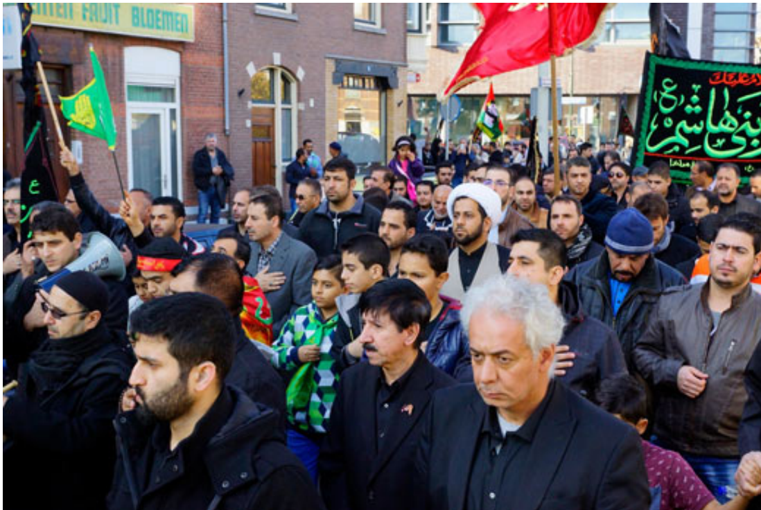
Sji'itische moslims in Den Haag in november 2014 tijdens een herdenkingsoptocht voor Hussein, de kleinzoon van profeet Mohammed Hussein.