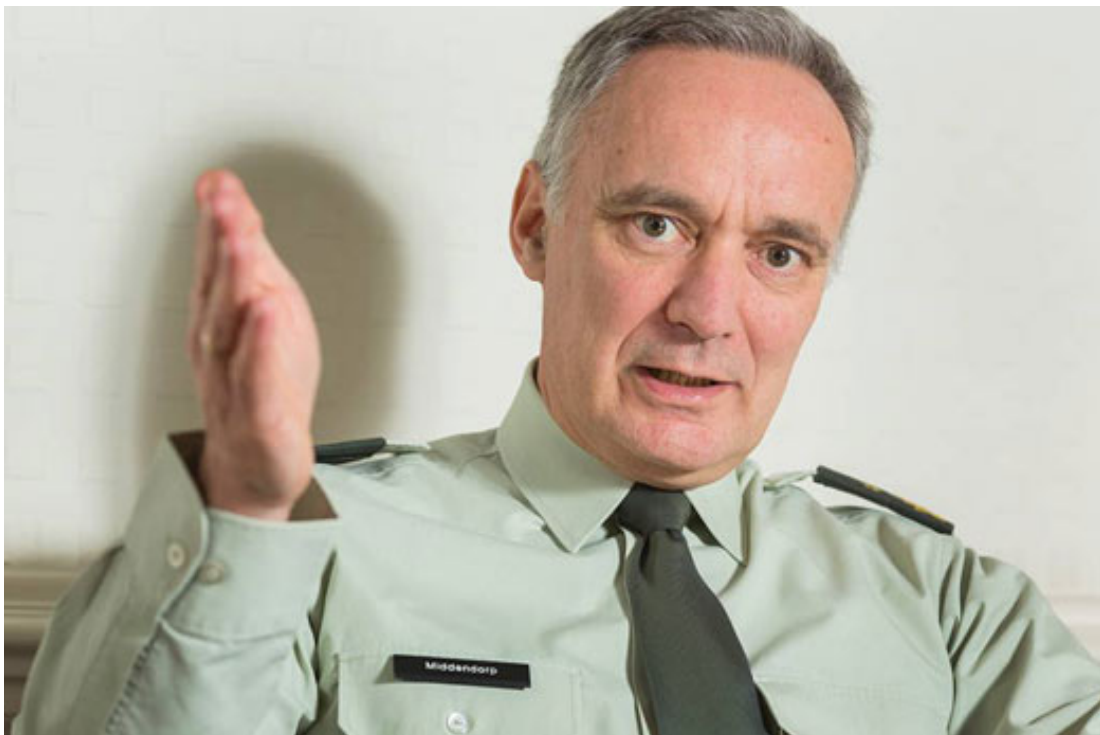
Nederlandse Commandant der Strijdkrachten Tom Middendorp.

Maar is het zo mooi? Als we de Nederlandse Commandant der Strijdkrachten Middendorp mogen geloven, is er namelijk bepaald geen reden tot optimisme over de toekomst van de samenwerking. In februari 2015 sprak hij tijdens een bijeenkomst van de Defensiecommissie van de Belgische Kamer van Volksvertegenwoordigers zijn zorg uit over de samenwerking, daarbij opmerkend: “Als er maar één partij beter wordt en de ander krijgt de rekening, dan is de bereidheid tot samenwerking een stuk minder.” [9] In zijn ogen dreigt het evenwicht in de samenwerking zoek te raken. Een zorg die ook door de Tweede Kamer gedeeld wordt. [10]