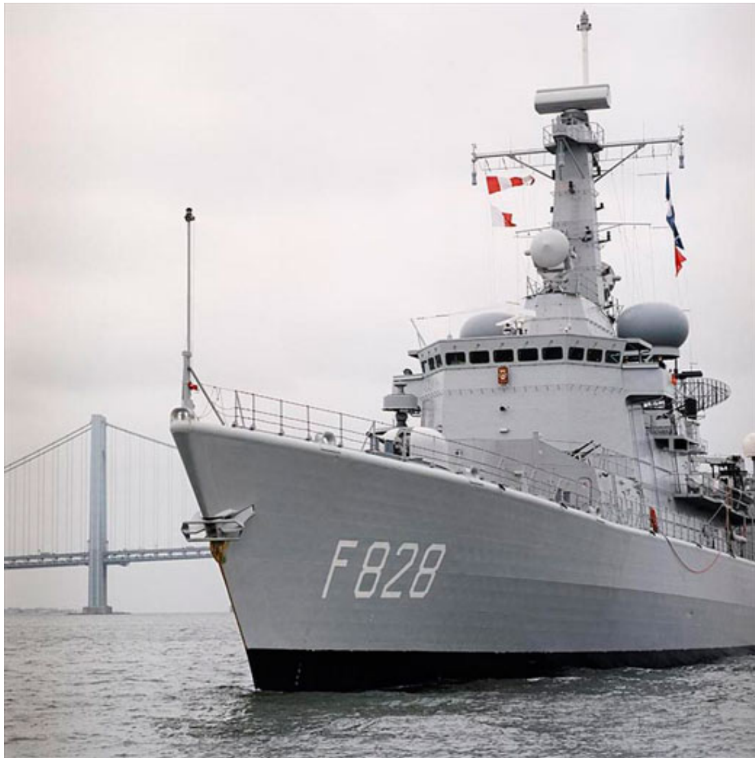
Een van de Nederlandse Multipurpose-fregatten (M-fregatten).

De samenwerking met België (en Luxemburg) beperkt zich bovendien niet tot de marines, maar strekt zich ook uit tot de landmacht en de luchtmacht. Als meest recente ontwikkelingen valt daarbij te wijzen op de overeenkomst om tot gezamenlijke bewaking van het luchtruim over te gaan (incl. Luxemburg) en het voorstel om samen met Belgische F-16's de inbreng bij de missie tegen Islamitische Staat voort te zetten.