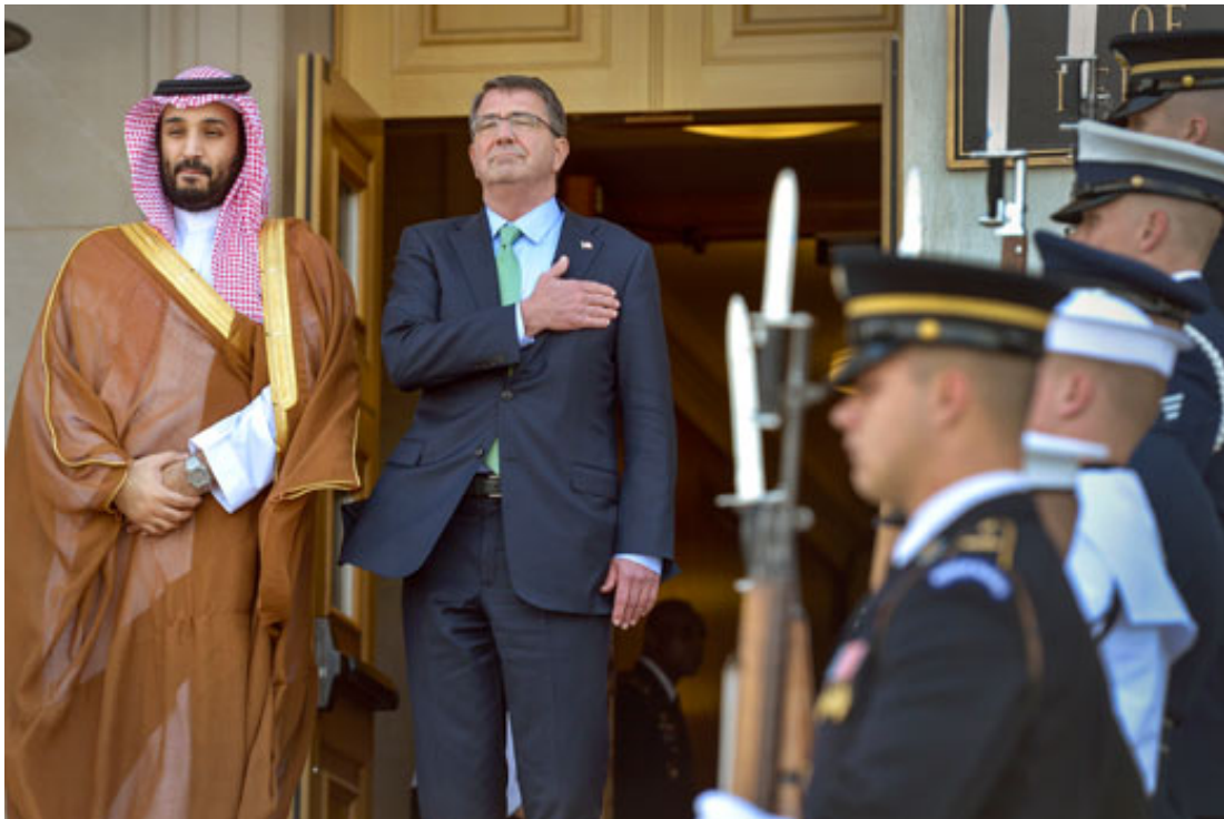
De Amerikaanse minister van Defensie Ashton Carter met zijn Saoedische collega Mohammad bin Salman al-Saoed.