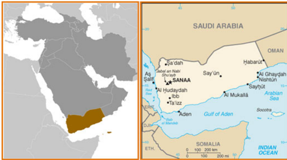
Figuur 1 – Ligging van Jemen op het Arabisch Schiereiland en de belangrijkste plaatsen in Jemen.

De politieke wanorde in Jemen wordt verergerd door de economische problemen. Jemen heeft een strategische ligging aan de Golf van Aden, Bab al Mandeb en de Rode Zee; zijn buurlanden zijn Saoedi-Arabië en Oman. Het landschap is echter ruig en onherbergzaam, en het land heeft weinig grondstoffen. Uit cijfers van de Wereldbank blijkt dat de landbouw onderontwikkeld is en 80% van de bevolking humanitaire hulp nodig heeft. [2] De begroting kent grote gaten en de regering ontvangt rond de 1,6 miljard dollar aan buitenlandse hulp per jaar.