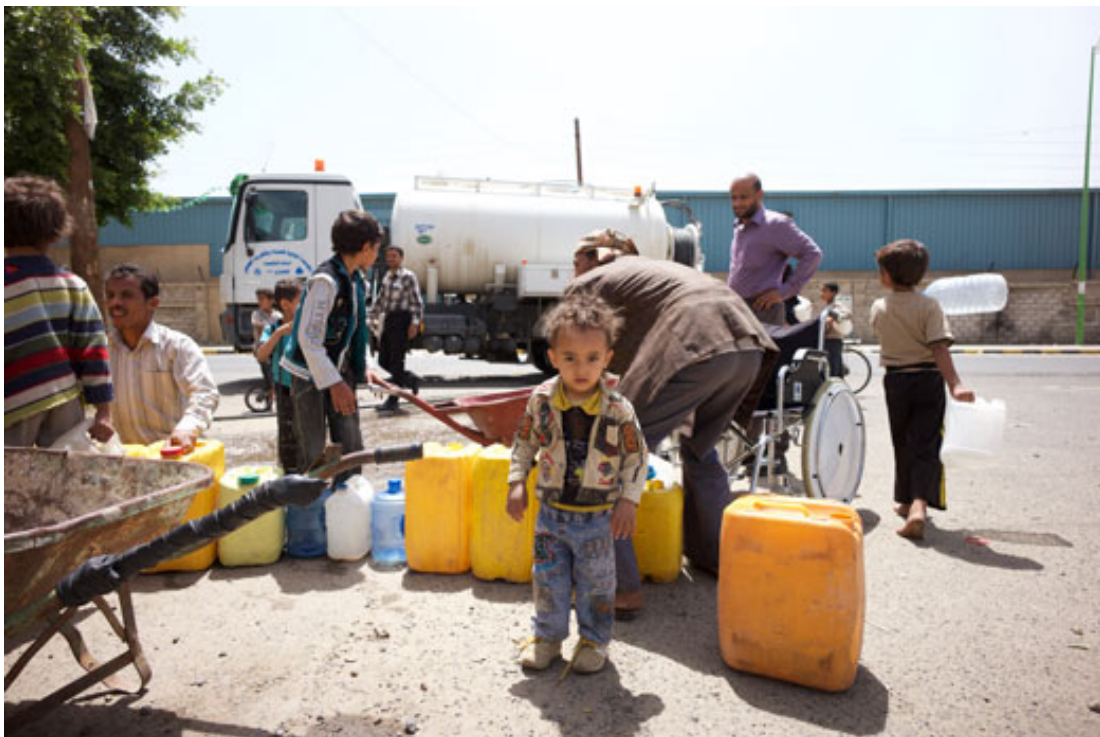
De oorlog vererbert Jemen's waterschaarste.

Een oplossing lijkt dus niet in zicht. Het conflict is ontstaan uit onenigheid tussen bevolkingsgroepen binnen Jemen en die partijen zullen met elkaar tot een oplossing moeten komen. De gemarginaliseerde partijen blijven echter de wapens opnemen om hun belangen te verdedigen. De eenzijdige luchtaanvallen die door de coalitie onder leiding van Saoedi-Arabië worden uitgevoerd, zijn bovendien een te simpele aanpak van een uitermate complex probleem. De aanvallen leiden tot woede en extra doorzettingsvermogen bij de Houthis. Op de korte termijn zal het de Houthis kunnen remmen in hun opmars, maar op de lange termijn zal het de achterliggende problemen van het conflict niet wegnemen en zelfs verergeren. Bovendien geeft het AQAP de ruimte haar machtsbasis verder uit te breiden.