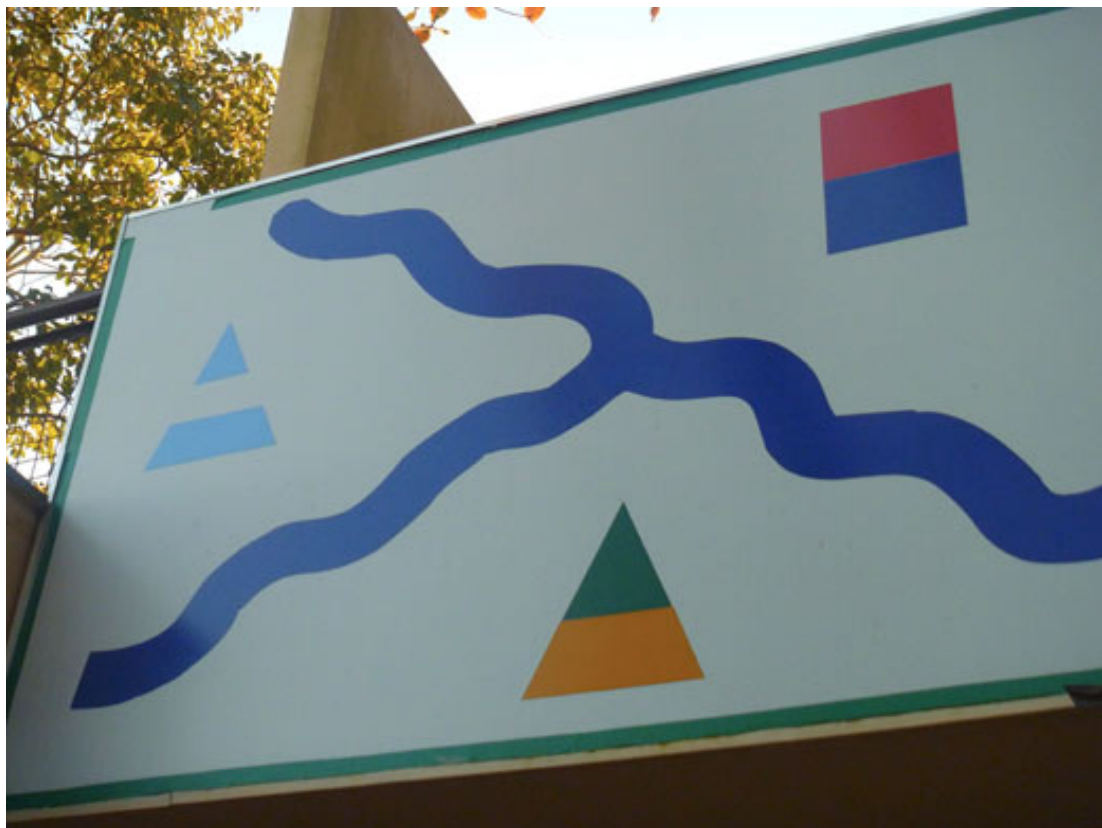
Het ‘Triple Frontera’-gebied tussen Paraguay, Argentinië en Brazilië.

Hoewel Cartes ontkent dat de sigaretten die opduiken in andere landen in de regio, afkomstig zijn uit zijn handel, is hij de afgelopen jaren door onderzoeksjournalisten in Mexico, Colombia en Brazilië beschuldigd van, niet alleen het smokkelen van sigaretten, maar zelfs van het witwassen van drugsgeld. [7] [8] Deze beschuldiging werd op hoger niveau ook al gemaakt door de Amerikanen. Een gelekte Wikileaks-kabel uit 2010 laat zien dat zowel Cartes als zijn bank (Banco Amambay) hoofdverdachten waren in een juridisch onderzoek van de Drug Enforcement Agency (DEA), genaamd ‘Operatie Hart van Steen’. [9] De kabel stelt Cartes zelfs aan het hoofd van een witwas- en drugsmokkel-netwerk dat actief was in het ‘Triple Frontera’-gebied, het grensgebied van Paraguay, Argentinië en Brazilië dat berucht is als centrum voor cocaïnesmokkelaars, marihuana-producenten en smokkelaars van (elektronische) goederen, sigaretten, wapens, en zelfs mensen.