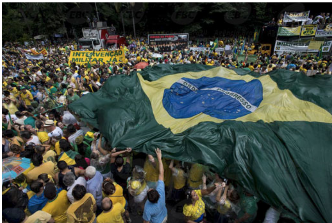
In het begin van 2015 protesteerden miljoenen Brazilianen tegen de regering van President Dilma Rousseff na een corruptieschandaal binnen de oliemaatschappij Petrobras.