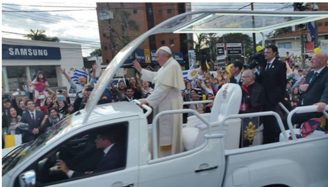
Paus Francisco over de 'Papa Road'.