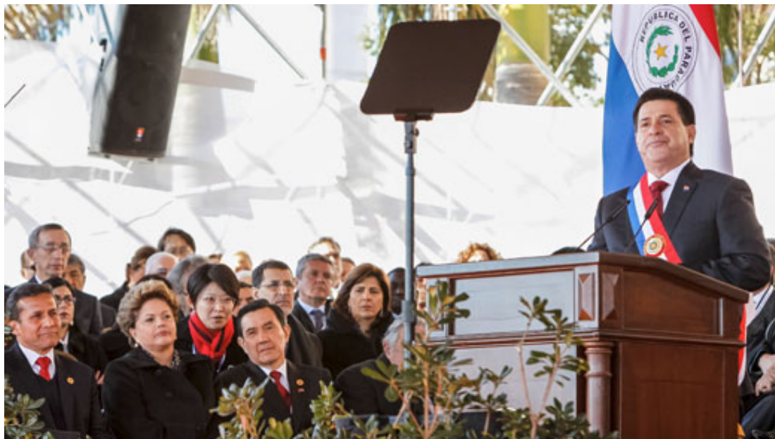
President Horacio Cartes.

Waar vroeger de militairen de dienst uitmaken, zijn het nu de drugsmokkelaars die volgens experts de ware macht in handen hebben. Dit is in eerste instantie mogelijk omdat zij populariteit genieten onder de lokale bevolking. Bij gebrek aan basisvoorzieningen, zoals onderwijs, gezondheidszorg en economische mogelijkheden, voelen vele arme burgers in afgelegen regio's zich in de steek gelaten door de staat. Een drugsbaron die kan zorgen voor geld, huizen, voetbalvelden, cadeautjes en buurtfeesten, wordt dan ook snel gezien als beschermheer van de armen.