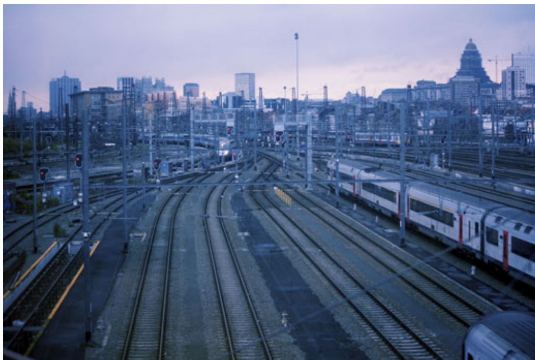
Het treinnetwerk van Brussel, waar de treinen uit Den Haag eindigen.

Gedurende deze periode is het voorstel van de Europese Commissie vrijwel volledig vervangen door voorstellen van de achtereenvolgende voorzitters Griekenland, Italië, Letland en – op het moment van schrijven – Luxemburg. Vooral het vervangen van de hiërarchische structuur, zoals voorgesteld door de Commissie, door een collegemodel met officiers van justitie uit alle lidstaten, heeft de belangrijkste bezwaren van de meeste nationale parlementen weggenomen.