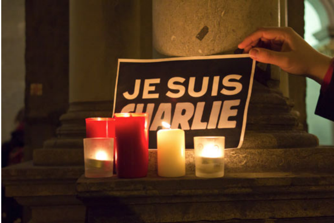
“Door de aanslagen op Charlie Hebdo in Parijs begin 2015 is het dossier terug van weggeweest als een belangrijke maatregel om terroristische aanslagen te voorkomen.”

passagiersgegevens. Nederland werkt met Europees geld aan een technische toepassing om het mogelijk te maken deze gegevens ook te kunnen gebruiken voor bestrijding van georganiseerde criminaliteit en terrorisme.